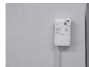
印刷機と印刷機との間の柱に設置