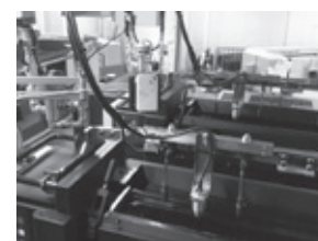
印刷機の上に設置(インク壺からやや離して)